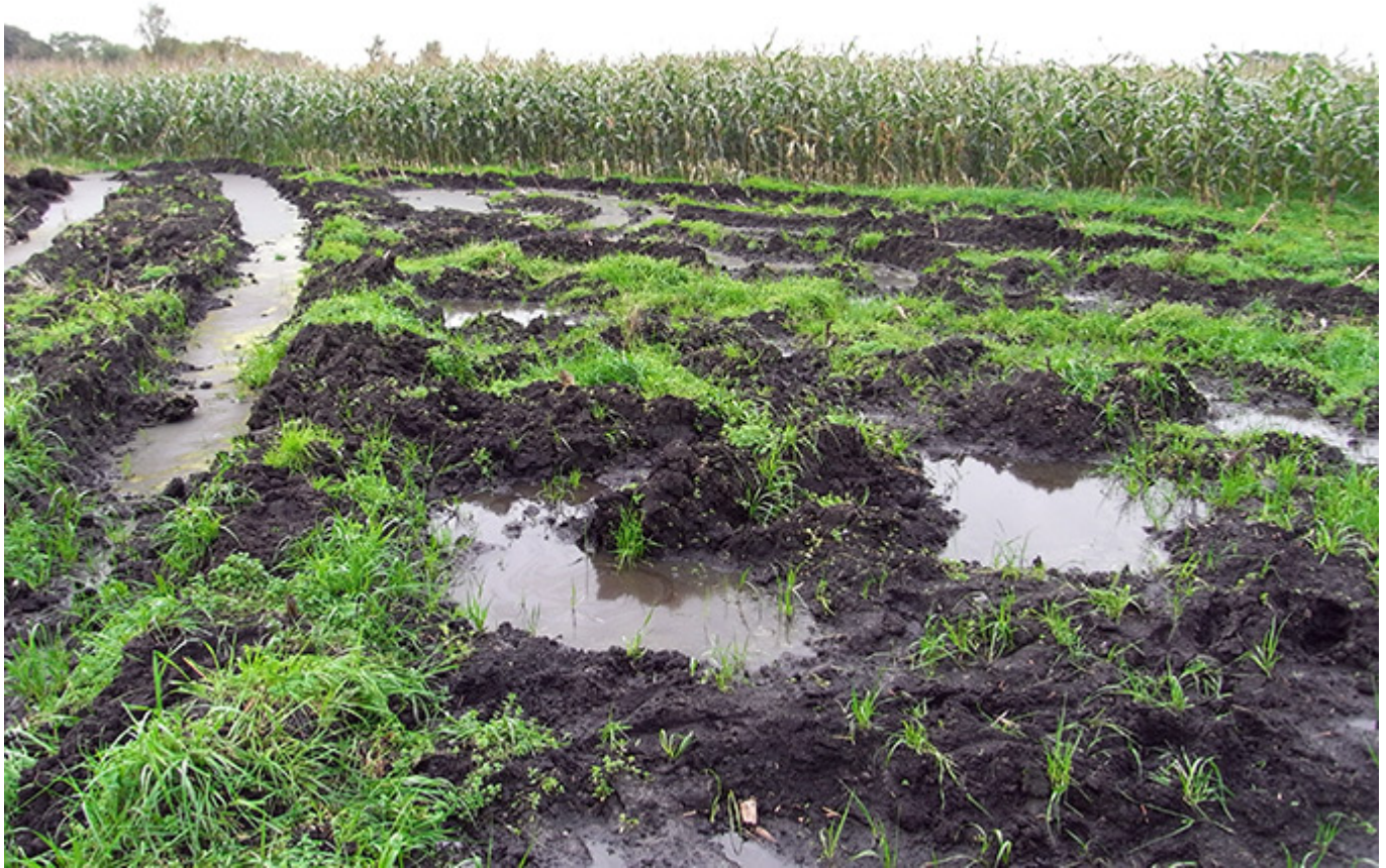
Grünlandumbruch Mais

Der Anbau von Energiepflanzen hat eine negative Öko-Bilanz. Er führt unter anderem zum Verlust wertvoller Lebensräume und schadet dem Klima. Besonders dramatisch in Deutschland ist der regionale Zuwachs an Maisäckern für die Biogasproduktion.