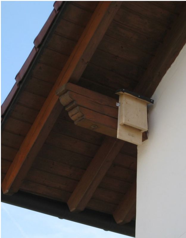
Beispiel für das Anbringen eines Fledermauskastens